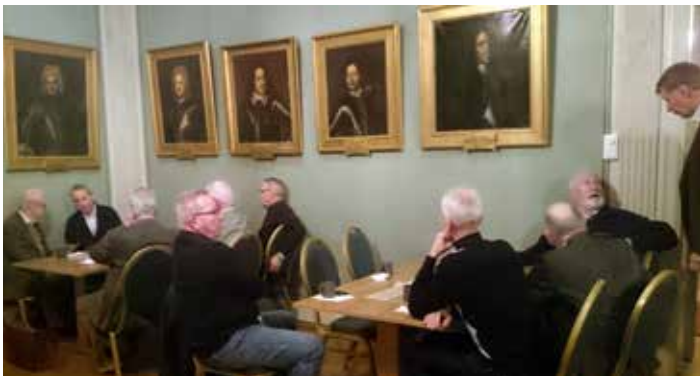
Innan årsmötesförhandlingarna intogs lätt förtäring under trivsamma former.

Fastställdes att tidning och verksamhet måste inrikta sig mera mot Hemvärnets personal vilka bör utgöra en möjlig rekryteringsgrund. För att få fler skribenter i tidningen behöver anvisningar tydliggöras i tidningen för hur artiklar bör utformas och dialogiseras över tiden med tidningsredaktionen.