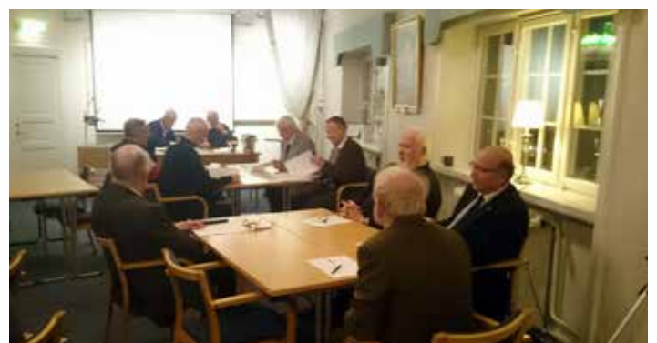
En trogen, intresserad och aktiv skara medlemmar ur Livgrenadjärföreningen.